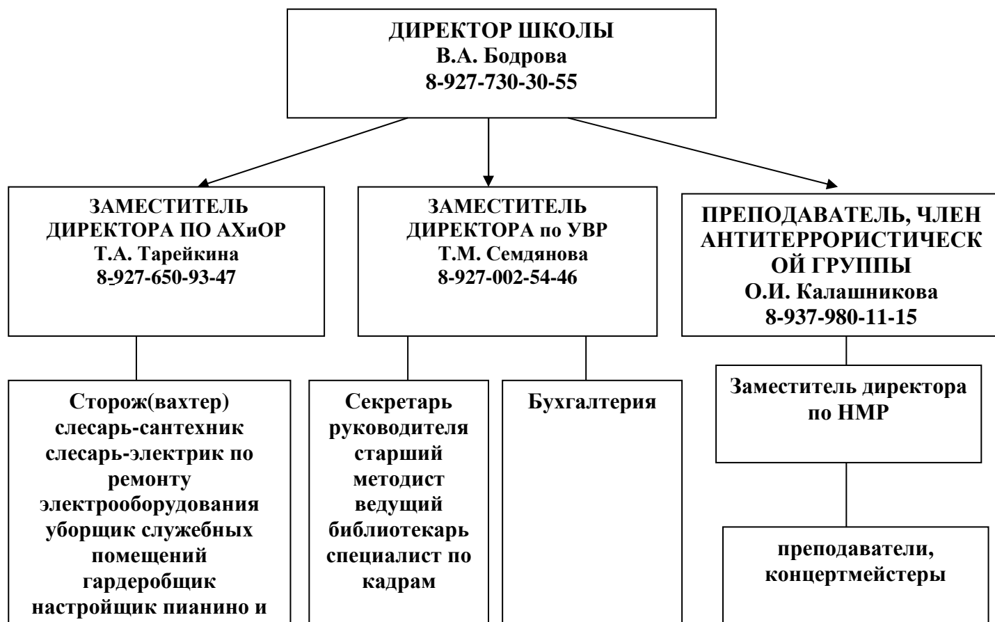
Схема оповещения составляется по принципу: «Каждый начальник отвечает за оповещение своего подчиненного» из расчета, что каждый сотрудник должен оповещать не более 4-5 коллег.

Для сокращения времени оповещения всего персонала и учащихся учреждения, в рабочее время, могут задействоваться селекторная связь, школьный звонок, сирена, охранно-пожарная сигнализация.