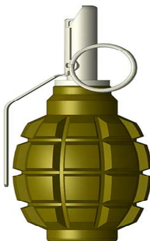
2. Граната Ф-1