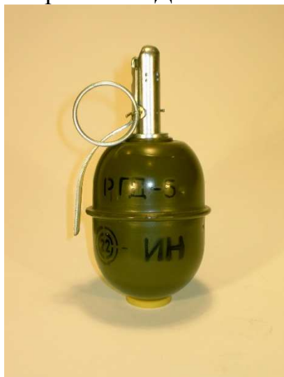
1. Граната РГД-5